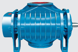
Ротационный вакуумный насос Максимальный вакуум 50 или 80 %

Не имеет изнашивающихся частей, является источником вакуума в передвижных пылесосах.