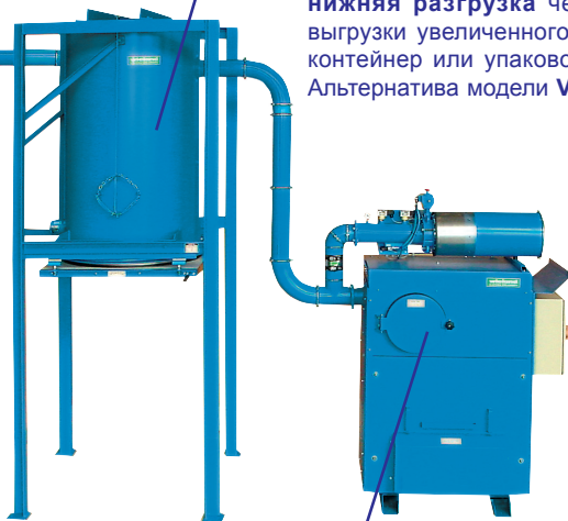
Вакуумный агрегат, модель KS-220, 22 кВт

Сепаратор отходов текстильного производства, модель TEX-1000, нижняя разгрузка через клапан выгрузки увеличенного диаметра в контейнер или упаковочный пресс. Альтернатива модели VS-3 T.