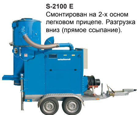
S-2100 E Смонтирован на 2-х осном легковом прицепе. Разгрузка вниз (прямое сыпание).