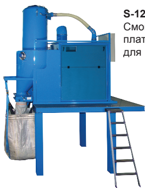
S-1200 E Смонтирован стационарно на платформе. Версия с клапаном для наполнения мешков BigBag.