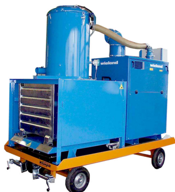
S-1200 E Container Закреплен на платформенной тележке. Съёмный 1000 л контейнер. Выгрузка и транспортировка контейнера вилочным автопогрузчиком.

Вакуумные агрегаты VacTrailer серии S оснащаются ротационным вакуумным насосом – 500 мбар, с системой воздушного охлаждения, обеспечивающим силу всасывания, достаточную для сбора хорошо перемещаемого материала на расстоянии до 100 м от точки всасывания по гибким шлангам диаметром 80 или 100 мм.